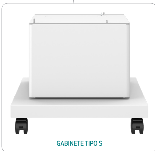
GABINETE TIPO S

Observación: Solo es compatible con las funciones de impresión. Las funciones de copiado/escaneo/fax no están disponibles en este modelo.